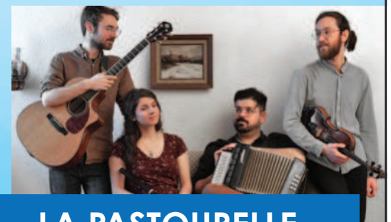
LA PASTOURELLE Représentations à 18 h et 19 h 30