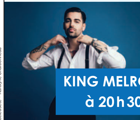
KING MELROSE à 20 h 30