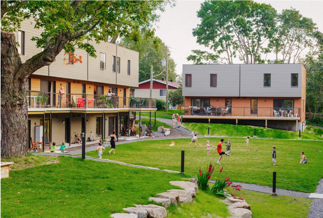
La cour intérieure de Cohabitat Québec, 42 unités, Source : Cohabitat Québec

Résolument tourné vers l'avenir, le COHABITAT est résolument une solution concrète en termes d'hébergement pour aînés dans tous les milieux.