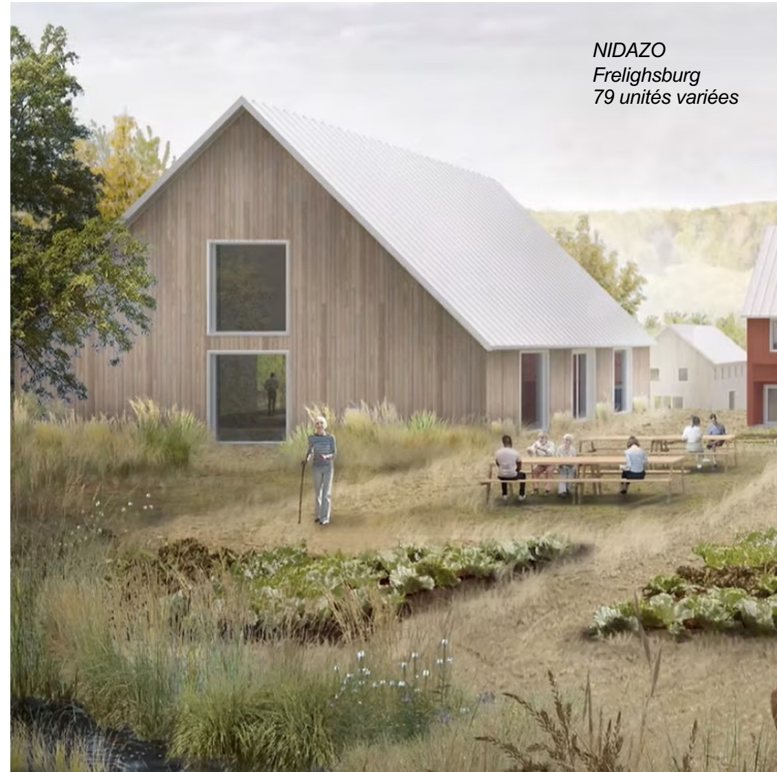
NIDAZO Frelighsburg 79 unités variées